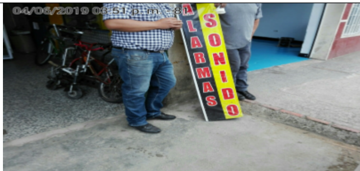
Fotografía panorámica del establecimiento de comercio SPECTRUM INGENIERÍA Y DISEÑO, donde se evidencia los incumplimientos anteriormente descritos.