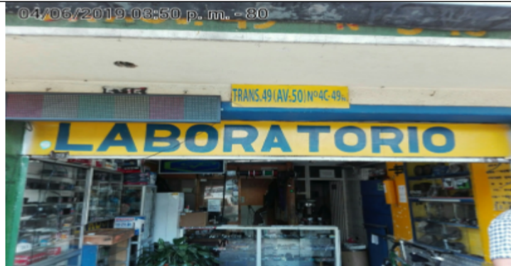
Fotografía panorámica del establecimiento de comercio SPECTRUM INGENIERÍA Y DISEÑO, donde se evidencia los incumplimientos anteriormente descritos.